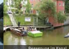
Begegnung im Kanal