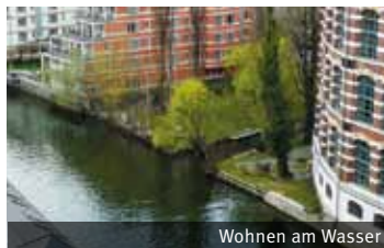
Wohnen am Wasser

Die Stadt Leipzig kann auf eine über 150-jährige wassertouristische Tradition zurückblicken. Durch den touristischen Gewässerverbund können die Sport- und Freizeitmöglichkeiten an den Fließgewässern zusätzlich mit der abwechslungsreichen Seenlandschaft der Region kombiniert werden.