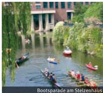
Bootsparade am Stelzenhaus

Nach rechts Richtung Westen abbiegen. Achtung Gegenverkehr, enge Stelle!