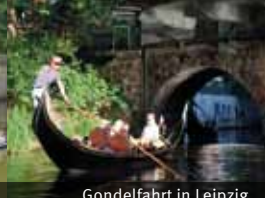
Gondelfahrt in Leipzig

Die Stadt Leipzig kann auf eine über 150-jährige wassertouristische Tradition zurückblicken. Durch den touristischen Gewässerverbund können die Sport- und Freizeitmöglichkeiten an den Fließgewässern zusätzlich mit der abwechslungsreichen Seenlandschaft der Region kombiniert werden.