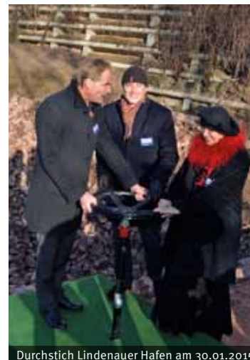
Durchstich Lindener Hafen am 30.01.2015

Mit der Realisierung der Gewässerverbindung zum Lindener Hafen wurde das Hafengebiet an das Gewässernetz des Leipziger Neuseenlandes angeschlossen. Bis zum Ende des Saale-Elster-Kanals bei Zschöcherger in Sachsen-Anhalt sind es rund 11 km.